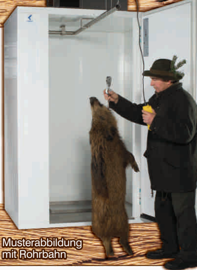
Musterabbildung mit Rohrbahn