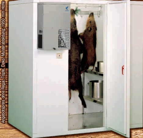
Musterabbildung mit Wildgehänge