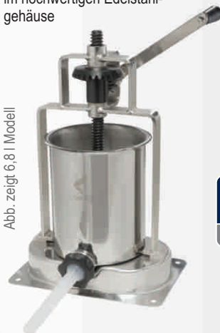
Abb. zeigt 6,8 l Modell