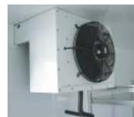
Verdampfer in der Kühlzelle